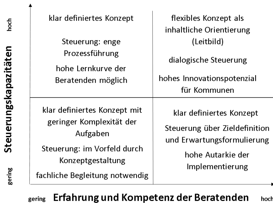
Abbildung 2: Umsetzungserfolg in Abhängigkeit von Projektsteuerung und Fachlichkeit der Beratenden

letztendlich im Zusammenhang mit den Kapazitäten der Projektsteuerung wie auch den Erfahrungen und Kompetenzen der Beratenden.