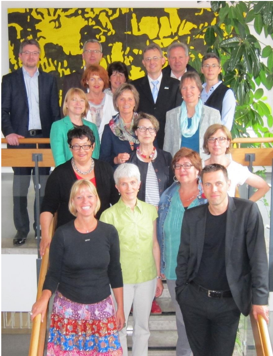
Projektbeteiligte zu Beginn des Modellvorhabens.

Die Abkürzung „PräSenZ“ steht für „Prävention für Senioren Zuhause“. Das Modellvorhaben dauerte mit Vorbereitungen und Auswertungen insgesamt vom 1.7.2014 bis zum 30.9.2017. Im Zeitraum von April 2015 bis Juni 2017 wurde die Erprobung des PräSenZ-Ansatzes mit PHB-Konzepten in drei Kommunen in Baden-Württemberg, und zwar in der Gemeinde Neuweiler (Landkreis Calw), der Stadt Rheinfelden (Landkreis Lörrach) und im Stadtkreis Ulm in Baden-Württemberg, durchgeführt.