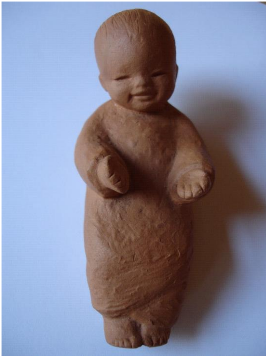
Jesuskind der Kleinen Schwestern Jesu, Jerusalem