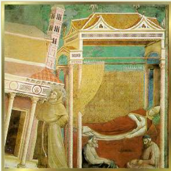
Giotto: Franziskus erscheint Papst Innozenz III. im Traum Fresko in der Basilika San Francesco, Assisi