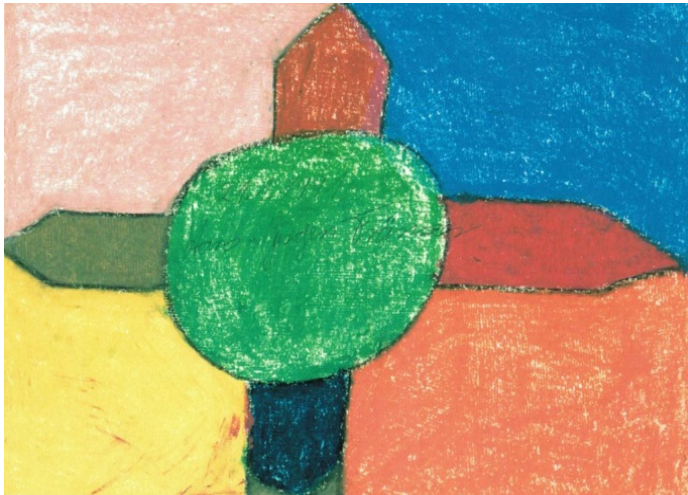
Hans-Jürgen Fränzer: Kreuz, Papier, Kreide, 1991 Kunsthaus Kannen / Alexianer Münster GmbH

Adressen von preisgünstigen Unterkünften werden mit der Anmeldebestätigung zugeschickt.